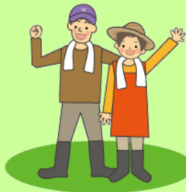
農林漁業者、 地域が元気に